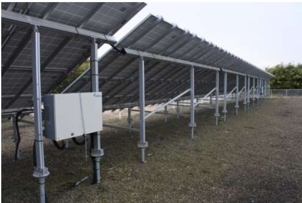
図4 ● 誤制御のあった太陽光発電所。東北電NWのミスで、パワーコンディショナー（PCS）が制御スケジュールを更新できなくなった

とはいえ、発電所サイトのPCSをリセットするには、ほとんどの場合、契約しているO&M（運営・保守）サービス会社に依頼して現場での作業が必要になる。東北電NWでは、当初この復旧費用は補償額に含めていなかった。そこで、きらきら発電市民共同発電所は、復旧費用の補償も要望し、最終的に認められたという（図4）。