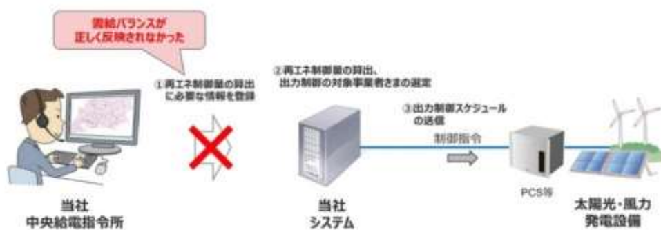
図3●中部電力パワーグリッドによる誤制御のイメージ

中部電PGによる誤制御の原因は、再エネ出力の抑制量を算出する中央給電指令所のシステムで運用にミスがあった。揚水発電に使う動力を手動で更新していたため、作業員の手違いで最新の揚水動力が反映されず、エリア需要が最新予測より小さく見積もられ、本来抑制する必要がない再エネ設備に対して制御指示が出されてしまったという（図3）。