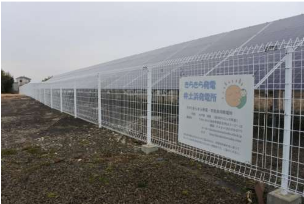
図2●誤制御のあった仙台市内の太陽光発電所

再エネに対する出力制御の運用では、2023年4月にも中部電力パワーグリッド（中部電PG）が、4月16日7時30分から8時00分の30分間、誤って本来必要ない出力制御を実施していたと発表した。誤制御によって出力を抑制された発電所は、オンラインによるリアルタイム制御の太陽光発電所・314カ所、合計出力は約110MWだった。